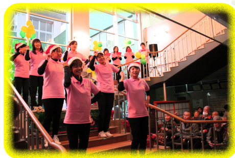
賀茂保育園職員の皆さん♪