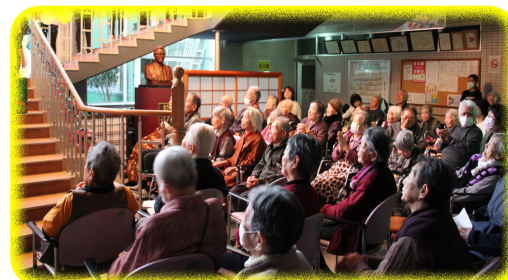
ご利用者・職員、約100人が参加♪