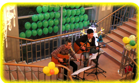
お馴染みのすてっふわごんさん♪